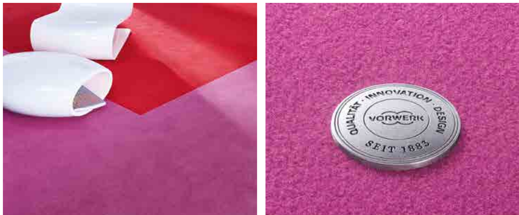
SUPERIOR 1063, Farbe | Colour | Couleur 1N61, 1N84

ES IST EIN SUPERIOR 1063! WENN ER DIE FÜSSE STREICHELN UND DIE AUGEN VERWÖHNT.