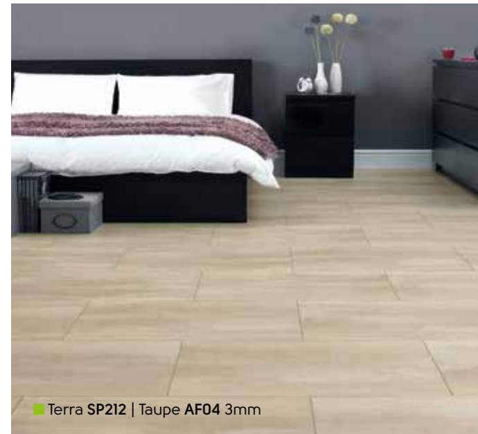
■ Terra SP212 | Taupe AF04 3mm