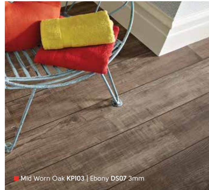
■ Mid Worn Oak KP103 | Ebony DS07 3mm