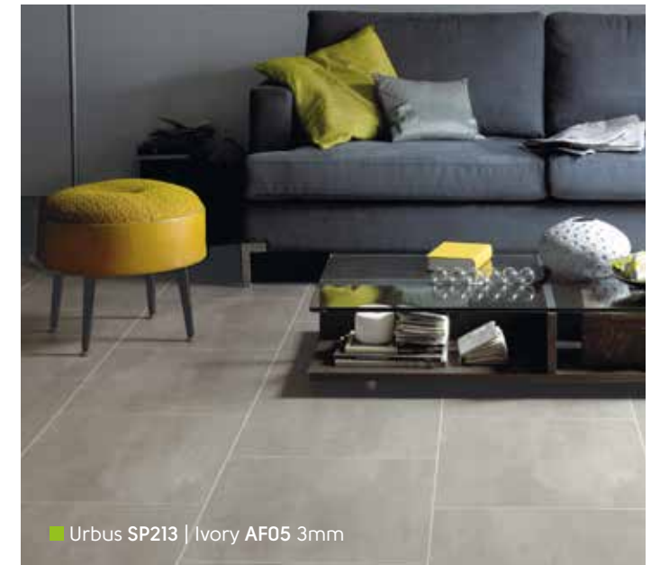
■ Urbus SP213 | Ivory AF05 3mm